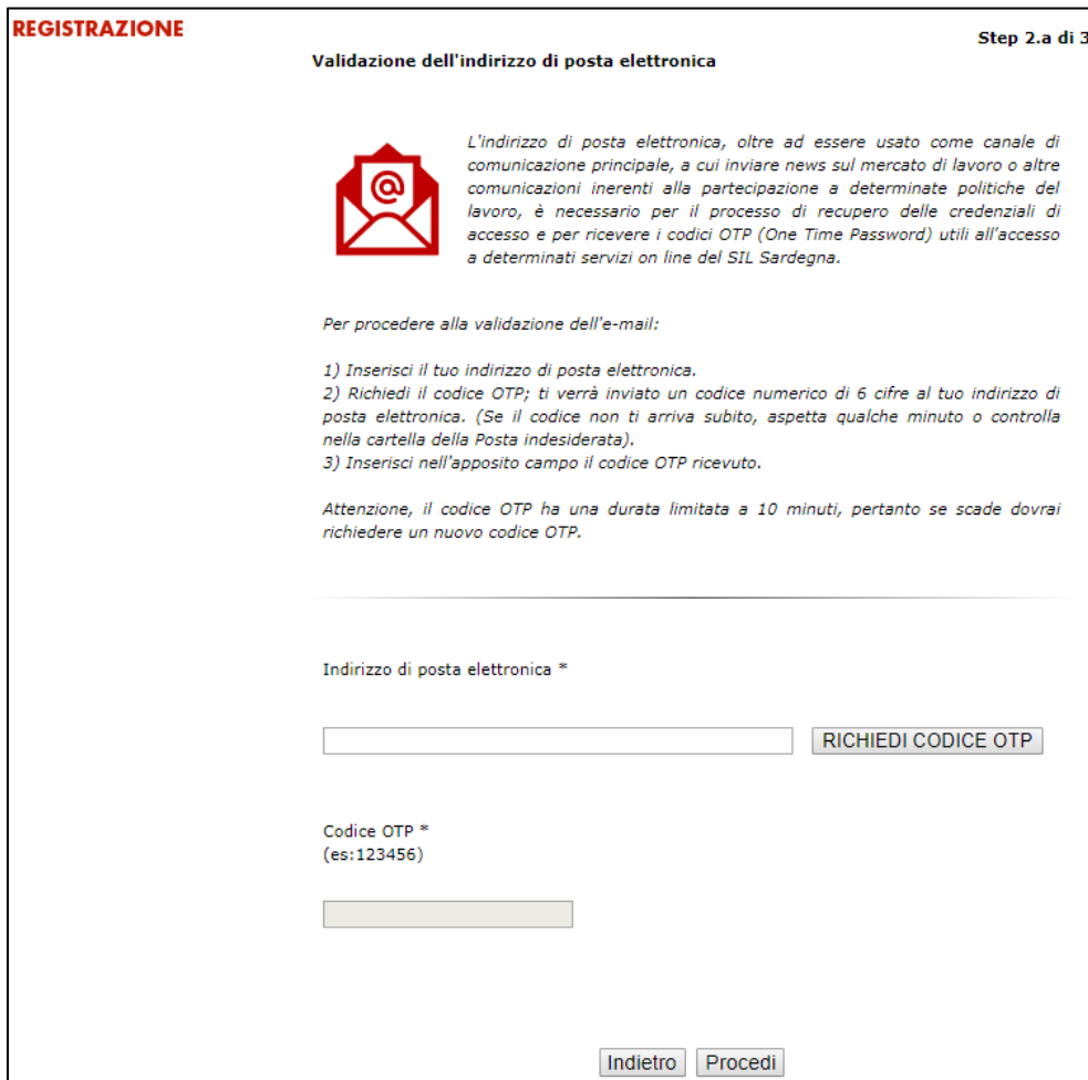
Figura 10: "Maschera Validazione dell'indirizzo di posta elettronica"

Vademecum per l'accesso ai Servizi Online